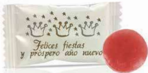
Caramelo Sobre SIN GLUTEN