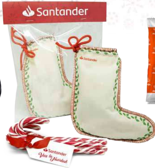
Bota Navidad (180x170 mm.)