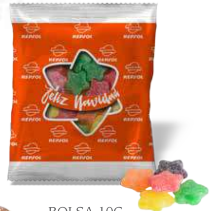
BOLSA 10G. GOMINOLAS ESTRELLA.