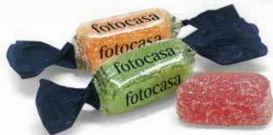
Pectina 2 lazos PAPEL BIODEGRADABLE