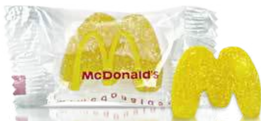
Flowpack Goma 3D SU MARCA EN GOMA 3D