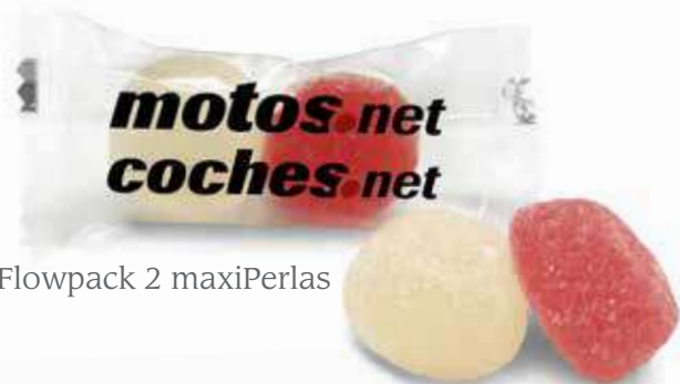
Flowpack 2 maxiPerlas